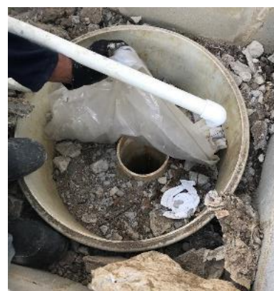
Foto No.2 Pozo profundo sellado

Se evidenció que el pozo profundo no cuenta con sistema de bombeo instalado, ni medidor de caudal, ya que no está en uso.