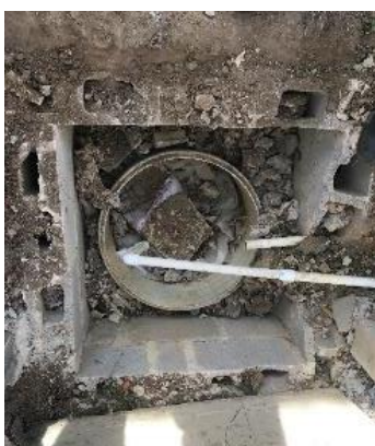
Foto No.1 Pozo profundo sellado

TEMPLADO S.A.S., cuenta con un pozo profundo ubicado en las coordenadas geográficas 10°51'31.20" N 74°53'47,60" O; el cual en el momento de la visita se evidenció que no es aprovechado y que este sellado.